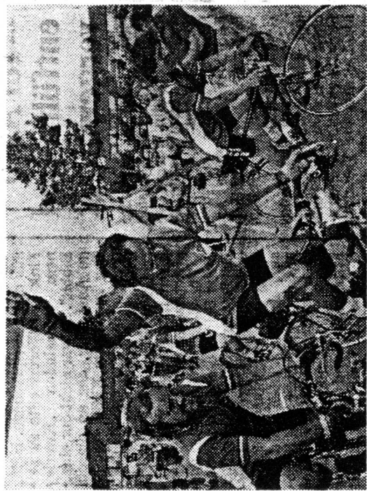
Ein letzter Gruß beim Start vom Fouesnant-Platz in Strümp. Von nun an hieß es „treten“ ...