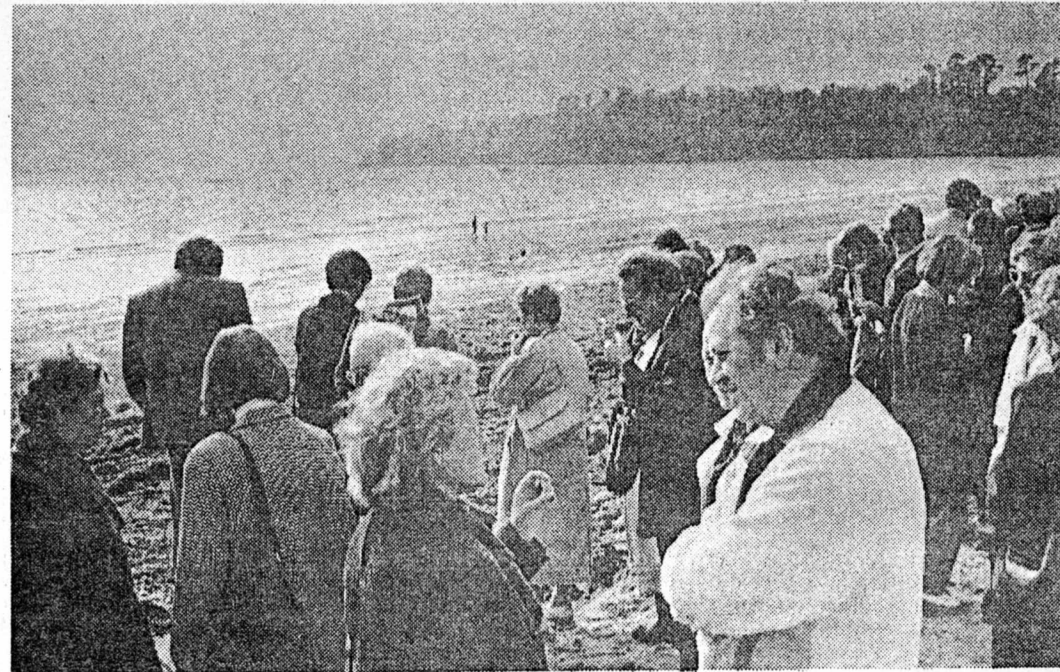
Hier am Cap Coz in Fouesnant bedeckt eine dicke Schicht von grünen Algen den feinen weißen Sand des Strandes.

Weitere Themen waren Sport und Flächennutzung in Fouesnant. Meerbusch erklärte den Partnern die Probleme der Wasserversorgung und Formen der Jugendarbeit.