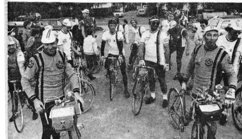
Vier Franzosen aus Fouesnant ließen es sich nicht nehmen, mit dem Rad aus ihrer bretonischen Heimat in Meerbusch »vorbeizuschauen«. Hier kommt die Gruppe gerade in Langst-Kierst an, wo sie vom RV Triumph empfangen wird.