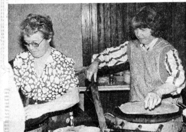
Mit Crêpes bewirtet wurden die Mitglieder des St. Stephanus-Chor bei ihrem Besuch in Fouesnant.

Alle waren sich einig: Das war bestimmt nicht die letzte Begegnung zwischen den beiden Chören. Aller Voraussicht nach wird der französische Chor im nächsten Jahr anlässlich des 75jährigen Bestehens des Stephanus-Chores nach Meerbusch kommen.