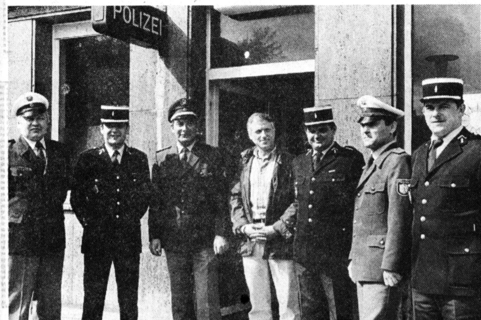
Kollegenaustausch: Französische Polizeibeamte aus Fouesnant besuchten ihre Meerbuscher Pendants in der Budericher Wache.