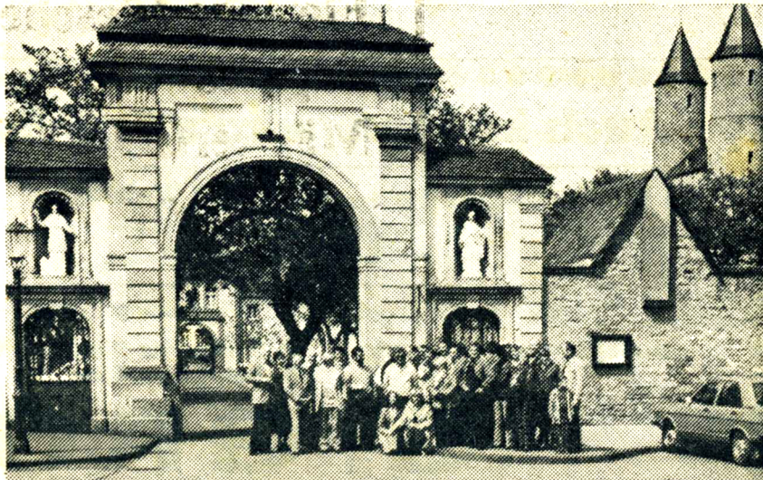
Das Kloster Steinfeld in der Eifel gehörte zu den vielen Stationen der Besichtigungsfahrten, zu denen die Meerbuscher Gastgeber ihre französischen Freunde eingeladen hatten.