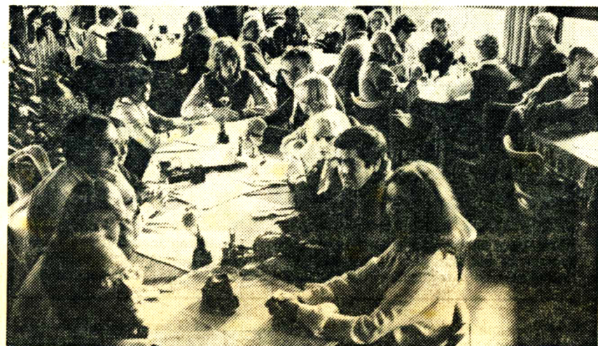
Gemeinsame Rast wurde während der Besichtigungsfahrten häufig eingelegt, damit das Pensum auch zu schaffen war.

chenende wurde schwer. Die Hoffnung auf ein baldiges Wiedersehen in der „glücklichen Bretagne“ tröstete sowie die Gewißheit, daß auch dieser Besuch zum Jubiläum die Freundschaft vertieft hat. Bedarf es noch eines Beweises dafür, so ist es sicherlich die Vereinigung des rheinischen Prosit und des bretonischen „Yerched mad“: In Fouesnant und Meerbusch heißt „zum Wohl“ (schon aus Tradition) „Prost Mad“. Wer wollte darauf nicht sein Glas erheben?