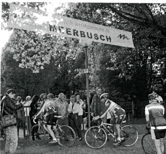
1112,3 Kilometer mit Gegenwind und doch pünktlich eingetroffen: Die Radsportler aus Fouesnant nach sechs Tagen im Sattel.

Dazu hatten die Bretonen Austern, Cidre und Muscadet mitgebracht.