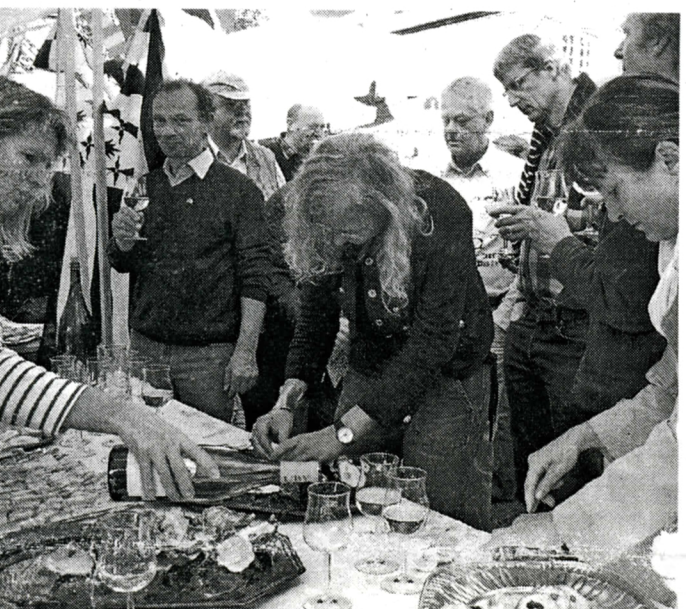
Wie isst man eigentlich Austern? Die Gäste aus Fouesnant schenken nicht nur frischen Muscadet aus, sondern erklärten, wie man die lebenden Schalentiere richtig schlürft.

Meerbusch (kir). Die Stimmung im Landtag war unerschlagbar. Wo sonst trockene Debatten vorherrschen, tanzten und sangen Deutsche und Bretonen ausgelassen zu den Klängen der Band „Heavy Gummi“, die Landtagsvizepräsident Oliver Keymis zum Besuch der Gäste aus Fouesnant eingeladen und bezahlt hatte. Zu diesem Zeitpunkt kurz vor Mitternacht hatten auch die Verantwortlichen bei der Stadt ihre Sorgen über die hohen (Buffet)-Kosten vergessen, die die Einladung von Keymis verursacht hatte. Das rheinische Buffet war vom „Patron“ des Landtagrestaurants, einem Bretonen (!), mit exquisiten, meist deftigen Speisen wie Matjes, Reibekuchen und Sauerbraten zusammengestellt worden und fand vollen Anklang.