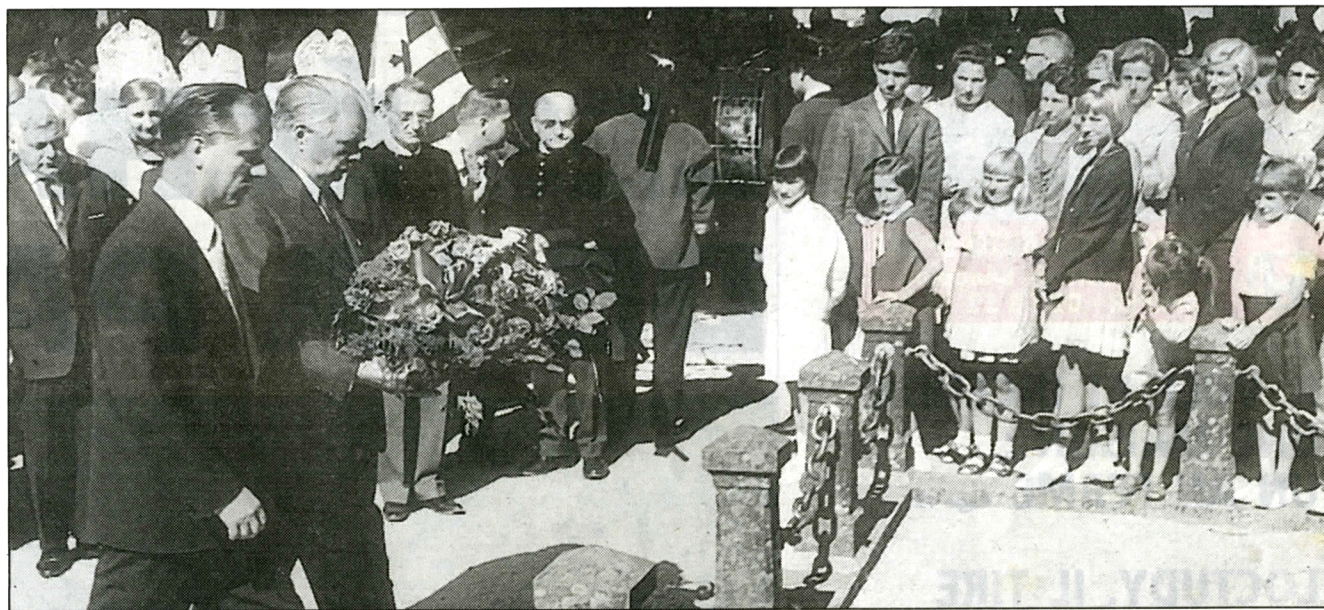
Un des premiers gestes de la délégation allemande a été de déposer une gerbe de fleurs au monument aux morts de Fouesnant. Tout un symbole.

Nous envisageons de réunir dans un an ceux qui, d'un côté comme de l'autre de la frontière, ont participé au jumelage. Nous avons en projet un grand rassemblement à Paris.