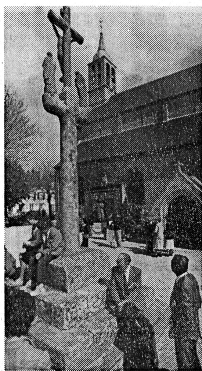
Die Pfarrkirche der Partnerstadt: St. Pierre.