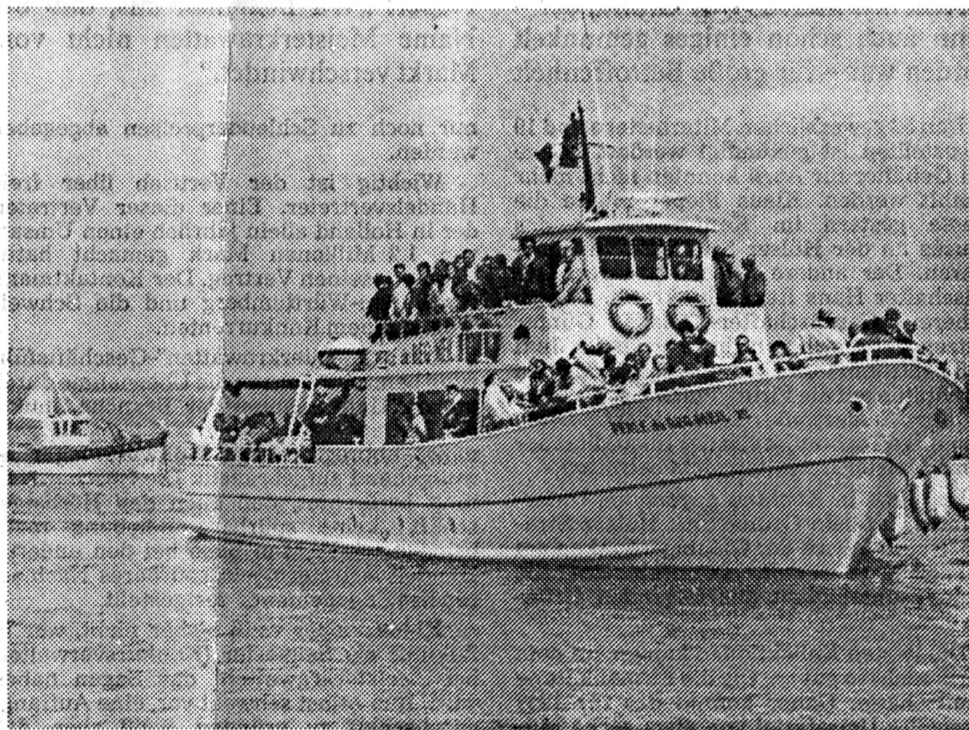
Meerbuscher und Fouesnanter auf großer Fahrt mit der „Perle von Beg-Meil“.