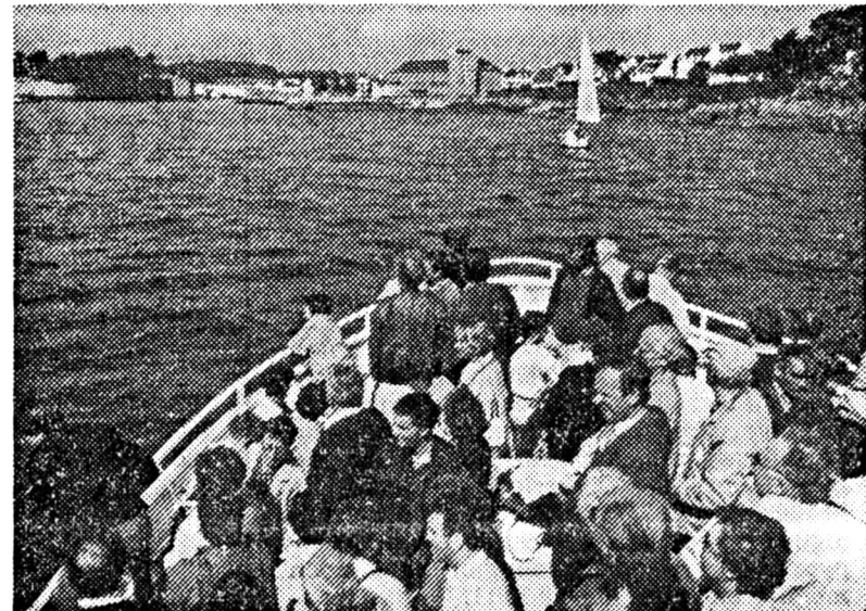
Einen Ausflug übers Meer nach Concarneau unternahmen die Meerbuscher bei ihrem Besuch in Fouesnant. Die Fahrt bei schönem Wetter und ruhiger See dauerte rund vier Stunden. An Bord ging es fröhlich zu.

sen am Samstag. Über vier Stunden wurde nicht nur gegessen und getrunken, sondern gemeinsam gesprochen, gesungen und Pläne für zukünftige Begegnungen gemacht. Schon Ende des Monats wird der Chor der Partnerstadt den Lanker St. Stephanus-Chor besuchen und die hiesige SPD nach Fouesnant reisen. Im August wird sich der RV Triumph Langst-Kierst Richtung Bretagne auf die Räder schwingen, außerdem wird es Treffen zwischen jugendlichen Sportlern und Erwachsenen beider Städte geben.