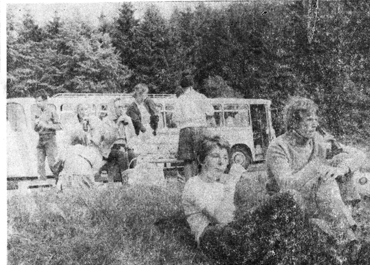
FOUESNANT. — Le pique-nique, lors de l'excursion dans le Sauerland. (Photo J. Nicolas).