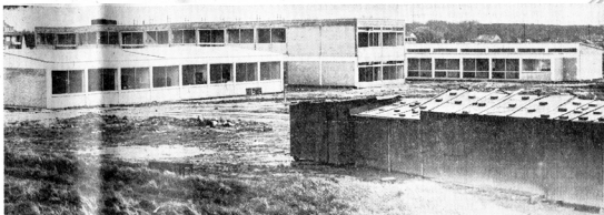
Die neue Schule in Strümp geht der Vollendung entgegen. Bis zum 5. April sollen alle Arbeiten erledigt sein, weil dann die Schule mit allen Räumen ganz bezogen wird. Dieser Neubau gibt der Gemeinde Strümp eine ideale Möglichkeit, die französischen Gäste aus Fouesnant zu empfangen.