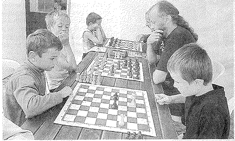
Échec et mat ?

Organisé les années passées dans la halle des sports de Bréhoulou, le forum des associations a trouvé un nouvel intérêt en s'implantant à l'Archipel et au restaurant municipal. Certes, les Fouesnannais y sont les mieux représentés, mais la manifestation sait attirer bon nombre d'activités exercées dans les communes environnantes, comme le rugby, le golf... « C'est au cœur de la ville dans un lieu qui est visité régulièrement. Le forum doit y rester. À l'avenir on doit pouvoir offrir davantage d'espace aux associations qui ont beaucoup d'adhérents, mieux équilibrer la répartition avec l'Archipel et s'ouvrir sur l'extérieur, » souligne