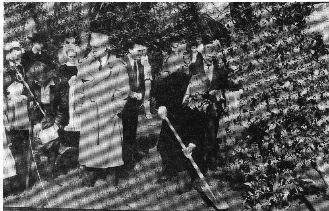
FOUESNANT. — Les autorités devant le chêne de Meerbusch.