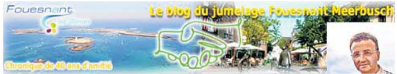
Symbolträchtig reichen sich Partner die Hände: Meerbusch und Fouesnant treffen sich im Internet.