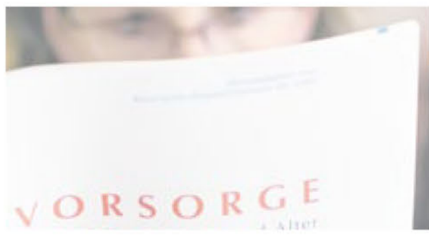
Freizeitangebote finden sich in der Broschüre ebenso wie Hinweise für Patientenverfügungen und Vollmachten.

Gerade alte Menschen sind häufig Zielgruppe Krimineller. Der Wegweiser gibt Ratschläge, wie man sich vor dubiosen Geschäftemachern an der Haustür oder Dieben und Einbrechern schützt. Weil auch Senioren unliebsamen „Papierkram“ zu erledigen haben, finden sich im neuen Heft auch wieder hilfreiche Hinweise zu Patientenverfügung oder Vorsorgevollmacht, zum richtigen Aufbewahren von Dokumenten oder zu Testamentserstellung und Erbschaftsfragen.