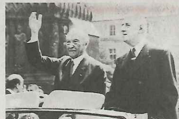
Annäherung: Konrad Adenauer und Charles de Gaulle.

Begegnung Die Nachbarn sollten sich mithilfe des Abkommens nach langer Erbfeindschaft wieder annähern. Der Vertrag setzte einen Schwerpunkt in der Jugend- und Kulturpolitik. Dabei sollten Schüler bestärkt werden, sich in Austauschpro-